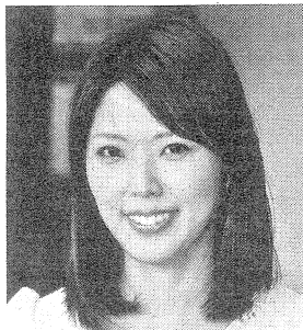
北岡組(美馬市) 営業部・働き方推進室長