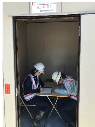
喫煙用のプレハブがあり◎