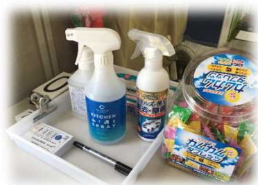
消毒を促すような掲示があると尚よいと思います!