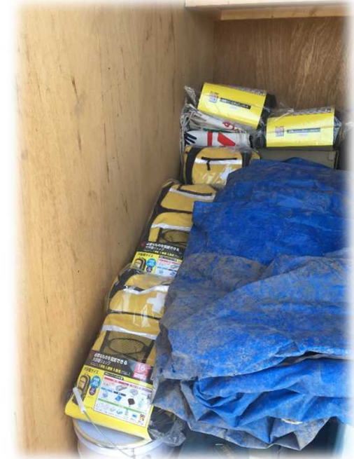
防災リュックの備蓄が良い!