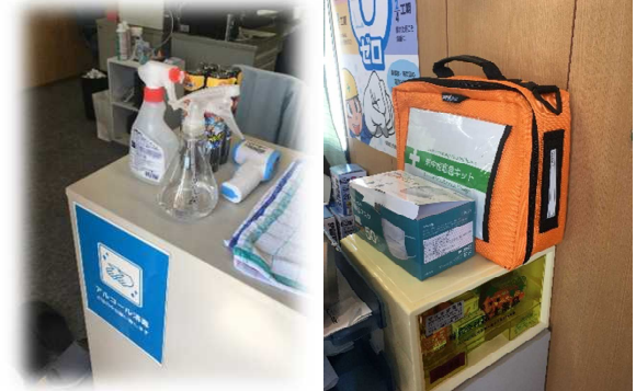
アルコール消毒や熱中症対策キットが十分に備えられていました