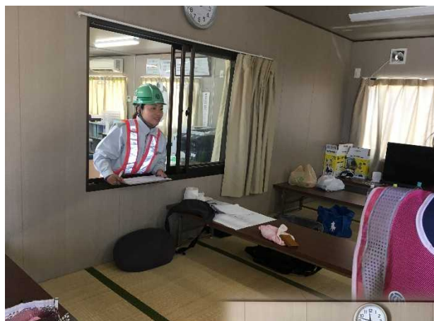
現場事務所と休憩所が隣り合わせで良い!