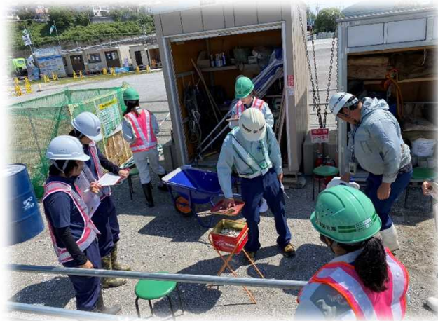
灰皿には水を入れてこまめに清掃しましょう