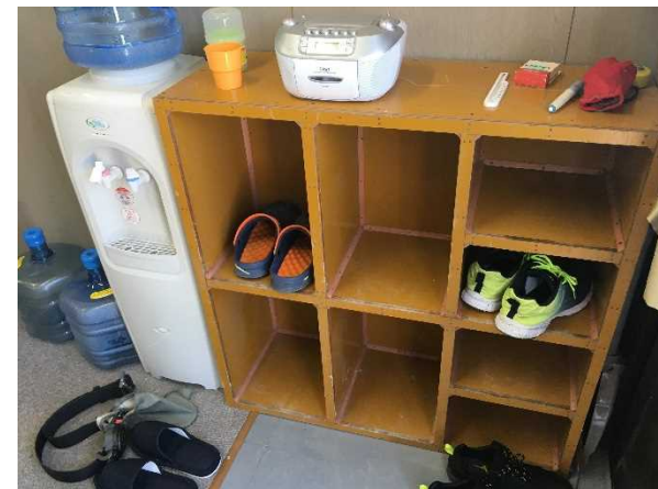
自作の靴箱が機能的!