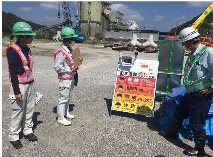
暑さ指数レベルが分かりやすくてよい◎