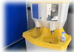
ハンドソープがすべての手洗いに設置されていました