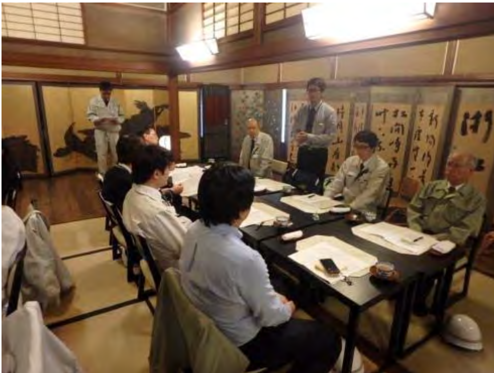
パトロール総評（平本旭川出張所長）