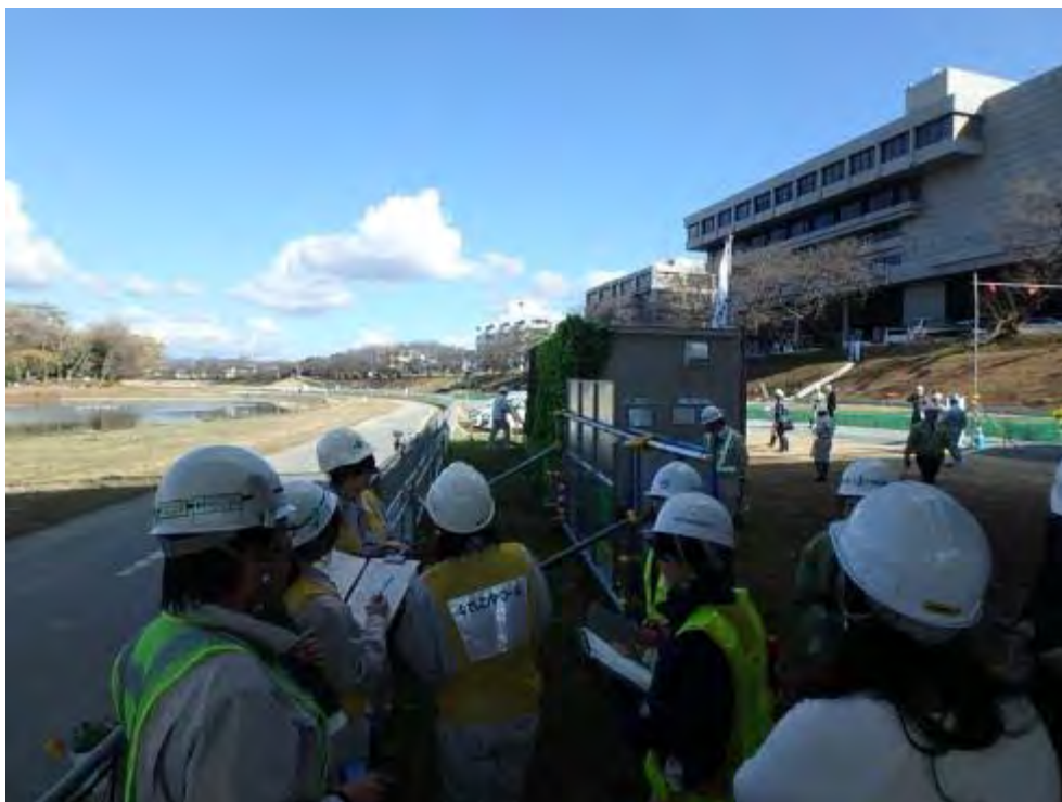
工事内容かんばん