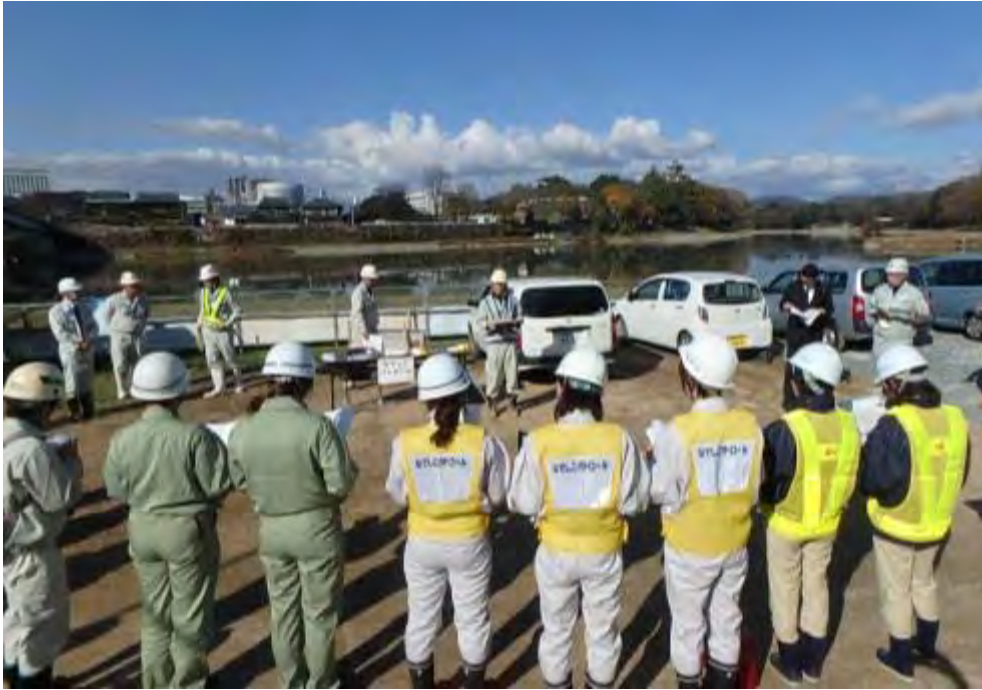
なでしこパトロール開始前の打ち合わせ